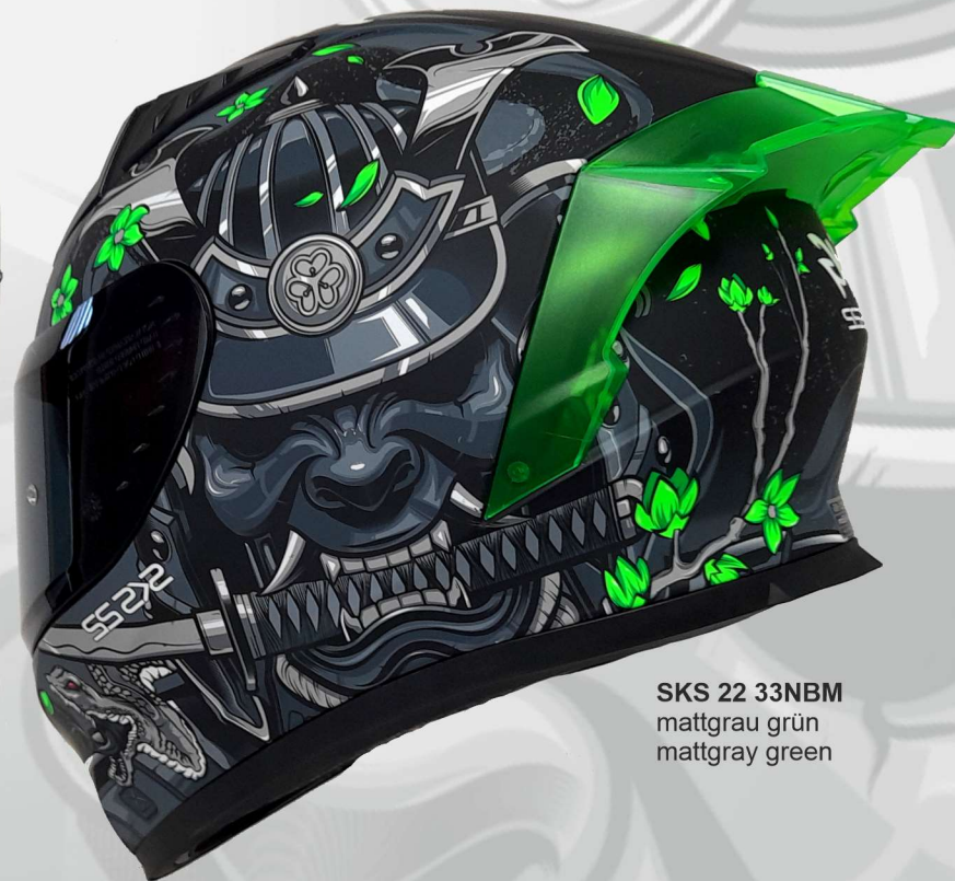
SKS 22 33NBM mattgrau grün mattgray green