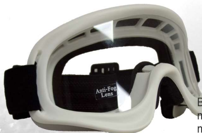
BRSMX U8BM mattweiss matt white

+++ lackierter Rahmen +++ klares beschlagfreies Brillenglas +++ mit siliconbeschichtetes, verstellbares, rutschfestes und auswechselbares Brillenband +++