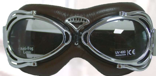
BRILLECLASSIC LUG CHBR

+++black painted or chrome ABS frame +++ Adjustable strap +++ Divided, light tinted anti-fog lens