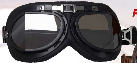
BRILLE RETRO SW

+++black painted or chrome metal frame +++ Adjustable strap +++ Divided, light tinted anti-fog lens