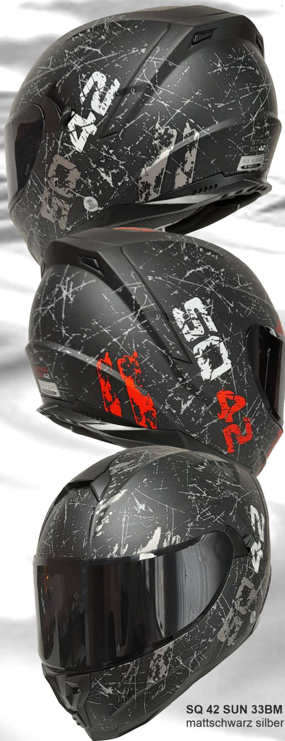
SQ 42 SUN 33BM mattschwarz silber