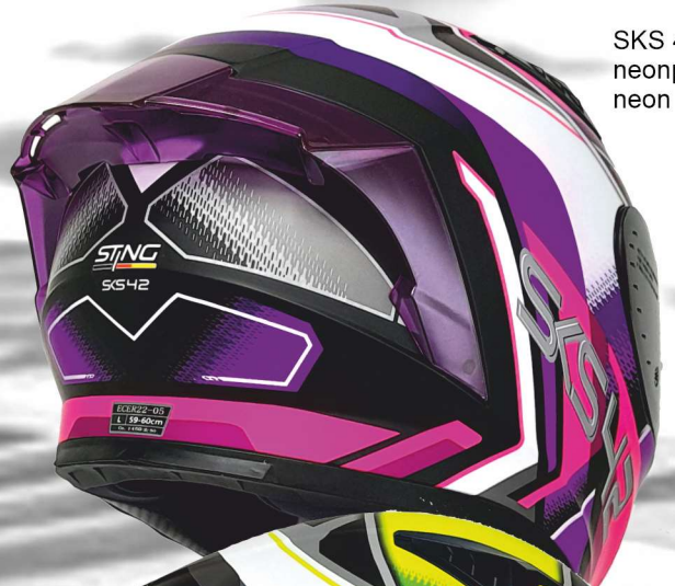
SKS 42 32NBM neonpink violett neon purple violet