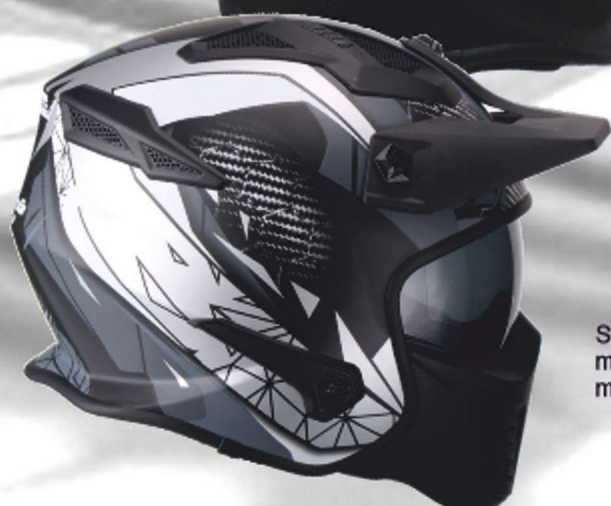
SM 33BM mattschwarz silber matt black silver