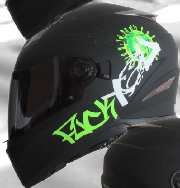
FY-C19 36BM mattschwarz grün matt black green

integriertes getöntes Visier +++ Zweischichtlackierung +++ Visierwechsel ohne Werkzeug +++ Atemschutz fürs Visier +++ Kinn-, Kopf- und Stirnbelüftung +++ Windabweiser +++