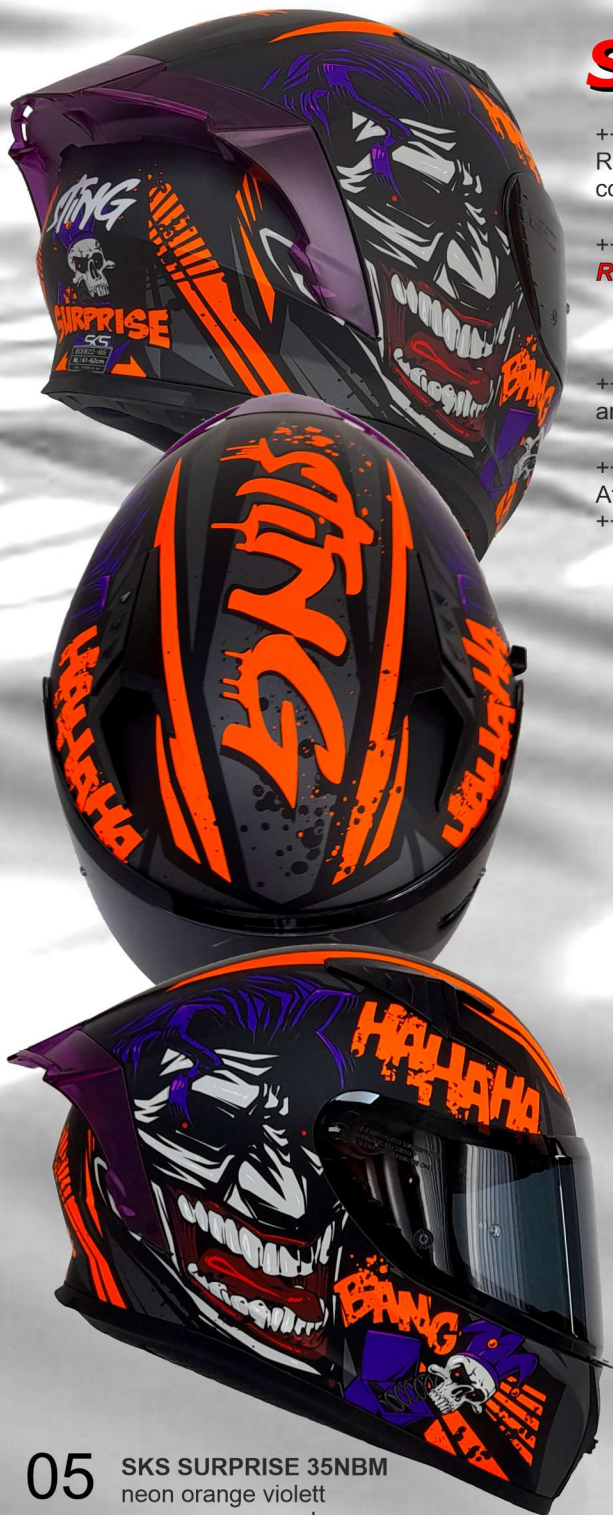
05 SKS SURPRISE 35NBM neon orange violett neon orange purple