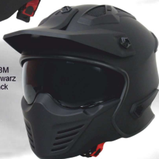
SM U9BM mattschwarz matt black

+++ Chin Air vents +++ Crown ventilation system +++ adjustable peak +++