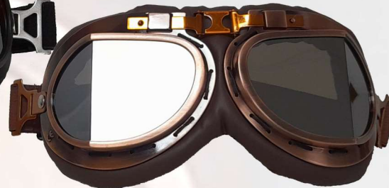
BRILLE RETRO KUPFER

+++ chrome , copper or black painted ABS frame +++ Adjustable strap +++ silver mirror or tinted lens