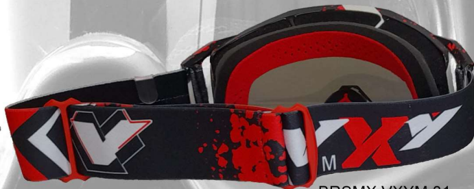
BRSMX VXYM 31 rot weiss red white