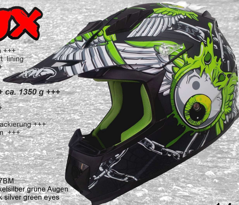
SMX 167BM mattdunkelsilber grüne Augen matt dark silver green eyes