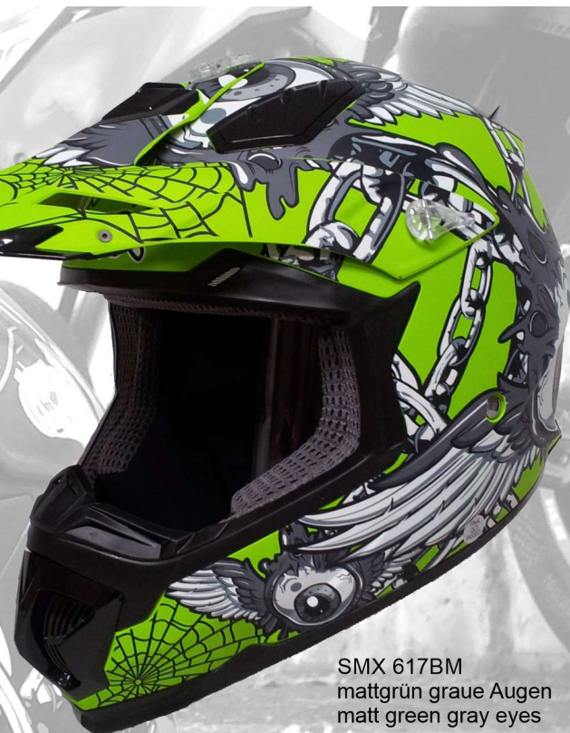
SMX 617BM mattgrün graue Augen matt green gray eyes