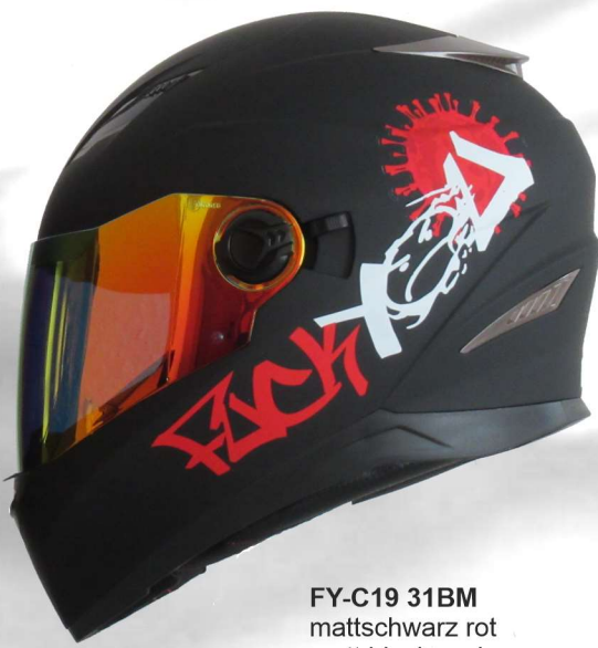
FY-C19 31BM mattschwarz rot matt black red