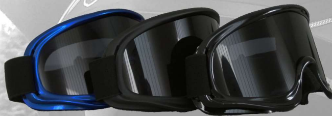
BRSMX U2 metallblau metal blue