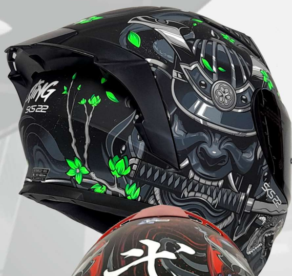
SKS 22 31NBM mattrot silber matted silver