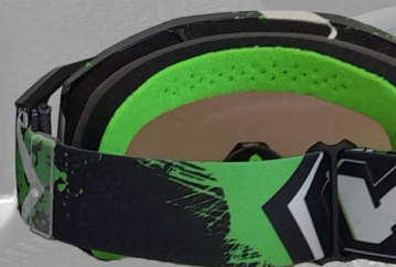
BRSMX VXYM 36 grün weiss green white