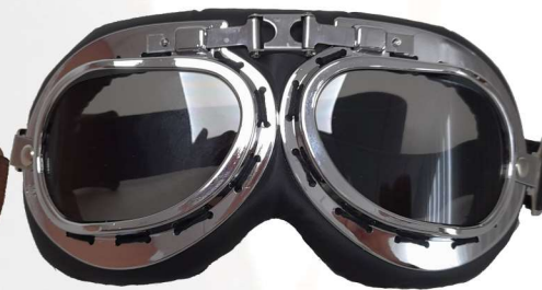
BRILLE RETRO CH

+++ chrome , copper or black painted ABS frame +++ Adjustable strap +++ silver mirror or tinted lens