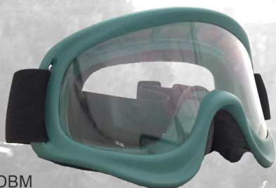
BRSMX U6DBM matt dirty green