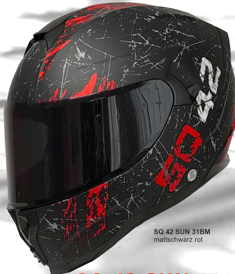
SQ 42 SUN 31BM mattschwarz rot