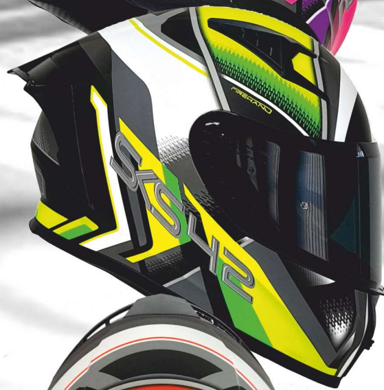
SKS 42 31NBM neonorange rot neon orange red