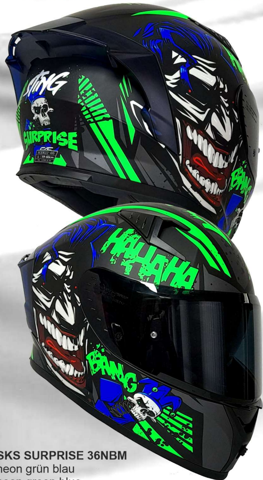
SKS SURPRISE 36NBM neon grün blau neon green blue

+++ Windabweiser +++ austauschbarer Heckspoiler, optional in 5 Farben +++