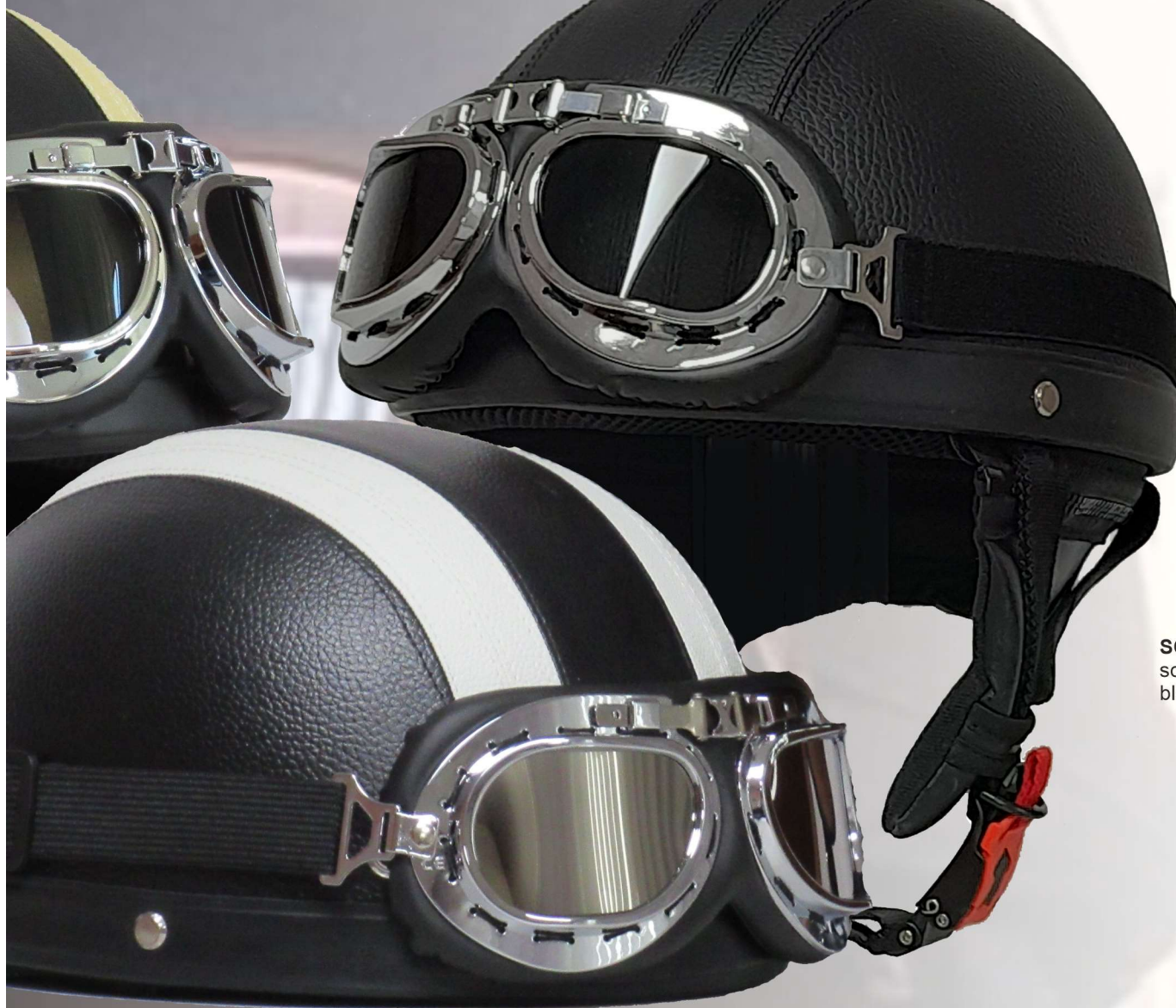
SCR U9 schwarz black

+++ Leather covered ABS shell +++ Ratched type chin strap system +++ Transpiring fabric comfort lining +++ Including STING Retro goggle +++ Goggle strap +++ Removable neck part +++