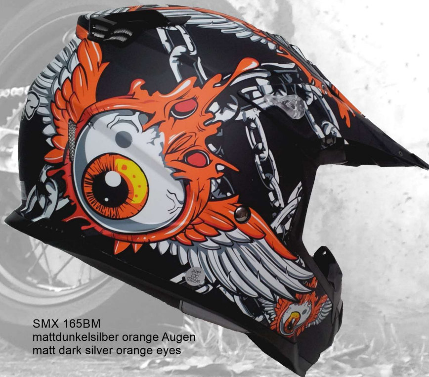
SMX 165BM mattdunkelsilber orange Augen matt dark silver orange eyes