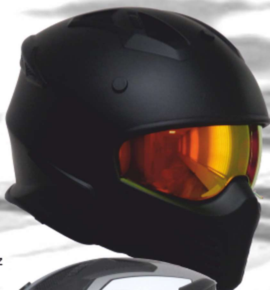
SM U9BM mattschwarz matt black