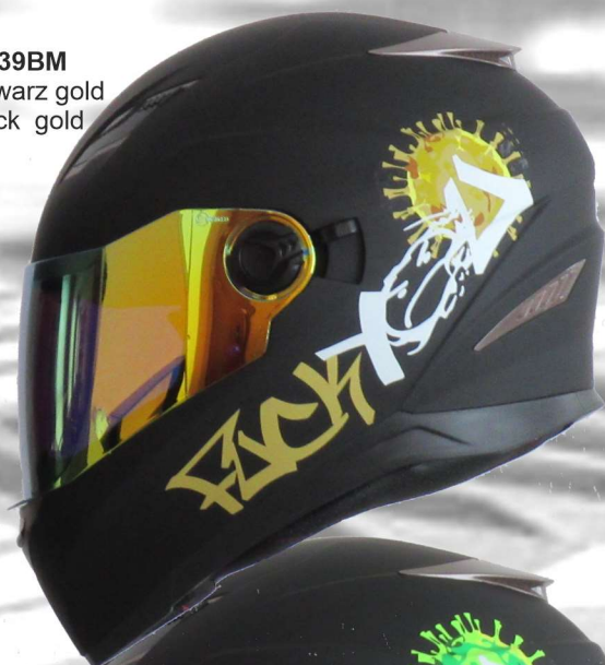
FY-C19 39BM mattschwarz gold matt black gold