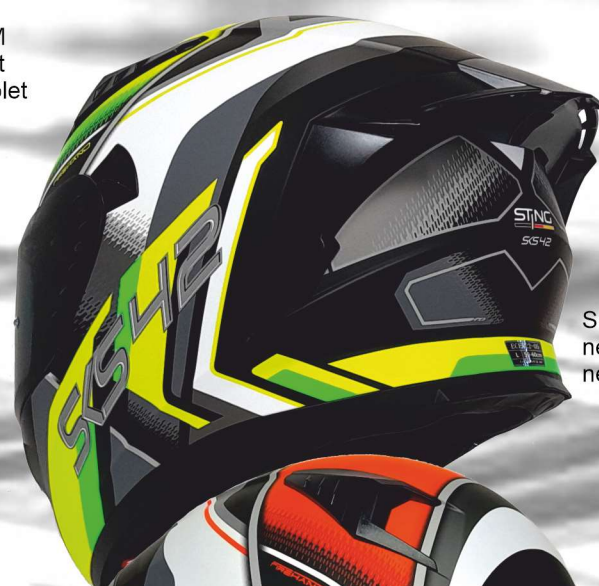
SKS 42 37NBM neongelb grün neon yellow green