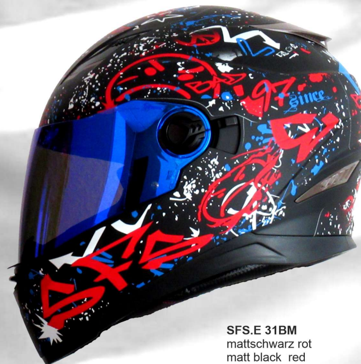
SFS.E 31BM mattschwarz rot matt black red