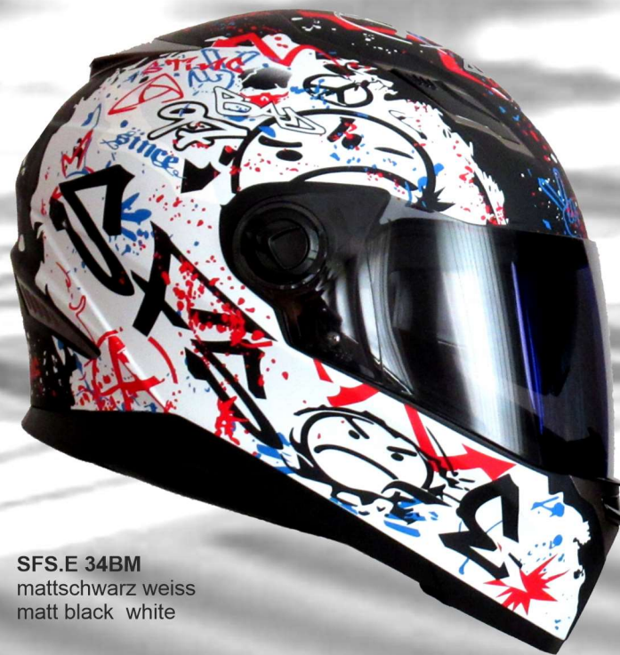
SFS.E 34BM mattschwarz weiss matt black white