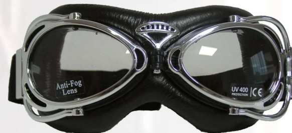
BRILLECLASSIC LUG CHSW

+++black painted or chrome ABS frame +++ Adjustable strap +++ Divided, light tinted anti-fog lens