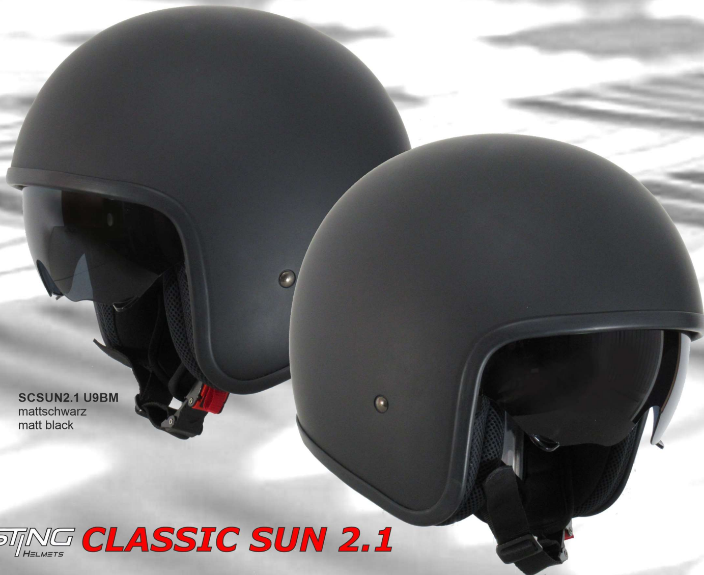
SCSUN2.1 U9BM mattschwarz matt black